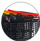
Cadena inicio Starter chain