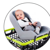
Cuna para bebés Baby seat