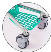
Ruedas para rampas Travelator wheels