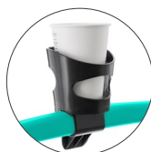
Porta-bebidas universal Universal drink holder