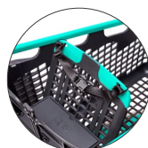
Cinturón para asiento de niños Safety belt for child's seat