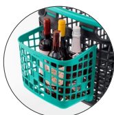
Cesta multiusos 10L Multi-purpose basket 10L