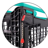
Monedero adaptado Adapted coin lock