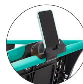
Portamóviles Mobile phone holder